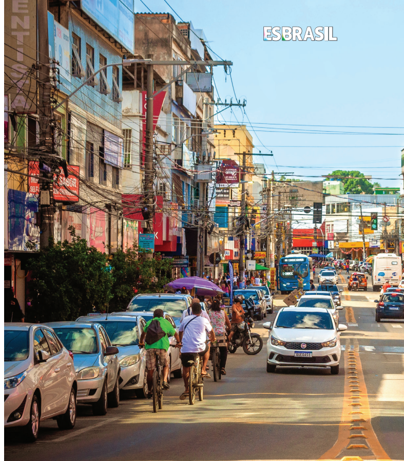
Avenida corta um dos centros comerciais mais importantes do Espírito Santo