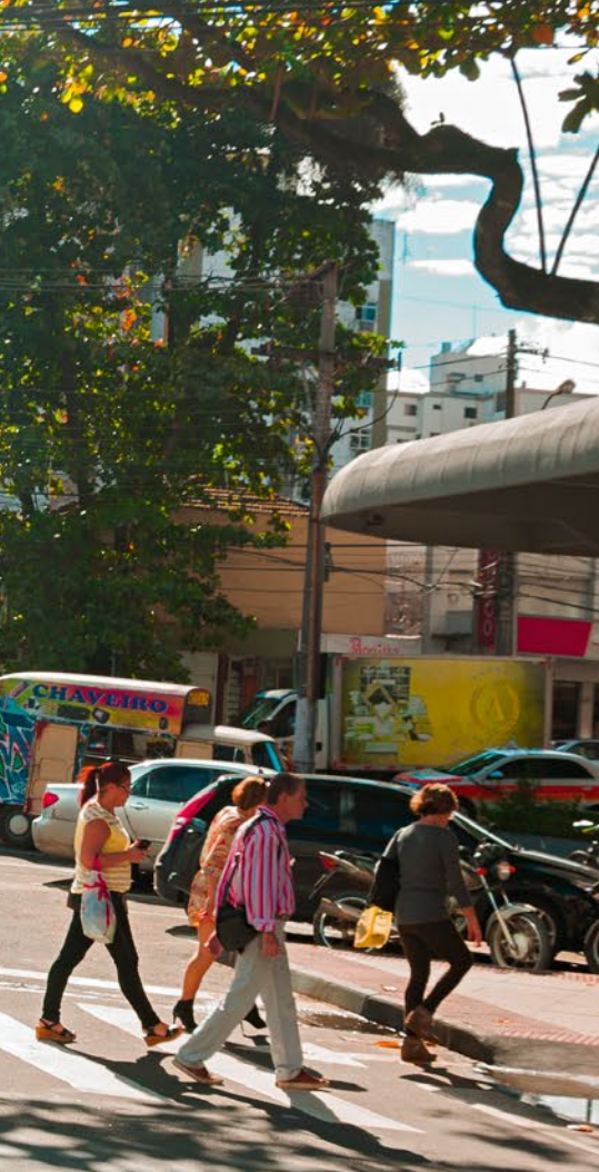
Milhares de pedestres e veículos transitam diariamente pela Rua Madeira de Freitas, seja apenas por passagem ou em busca de um dos mais variados estabelecimentos comerciais que a via abriga